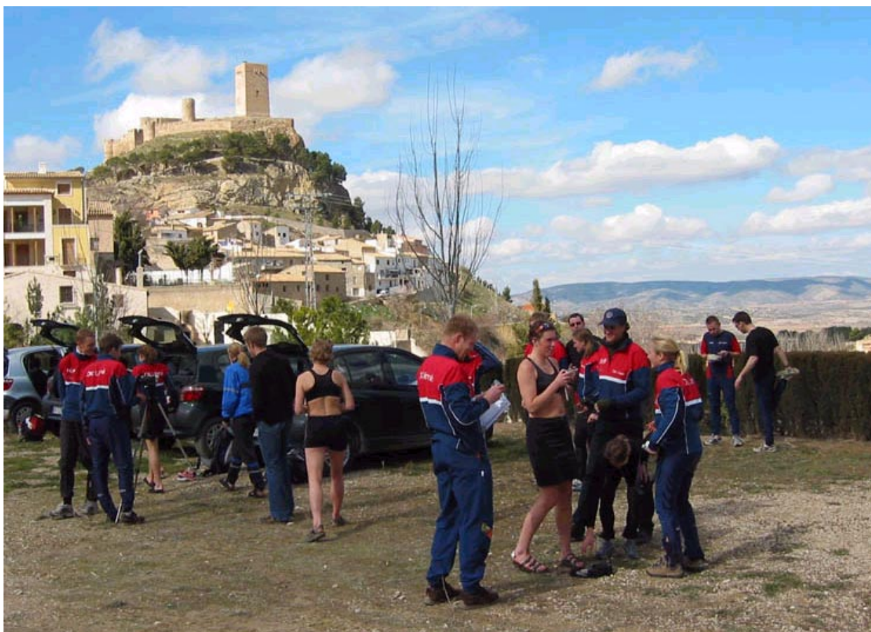
Här i Biar gick klassiska JVM.