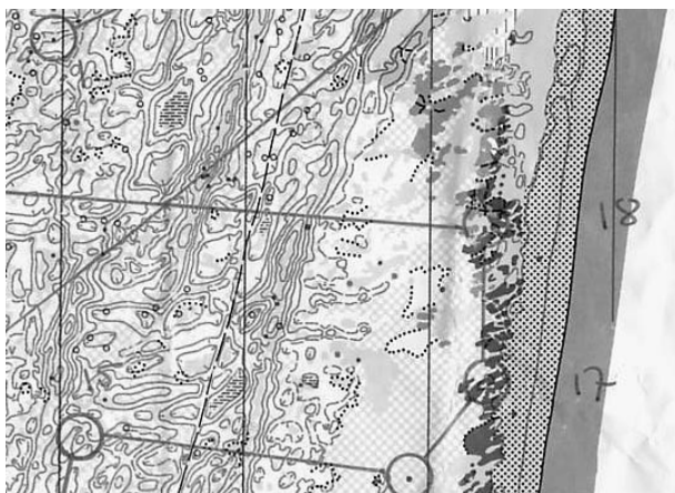
Strandkartorna i Guardamar var uppskattade.