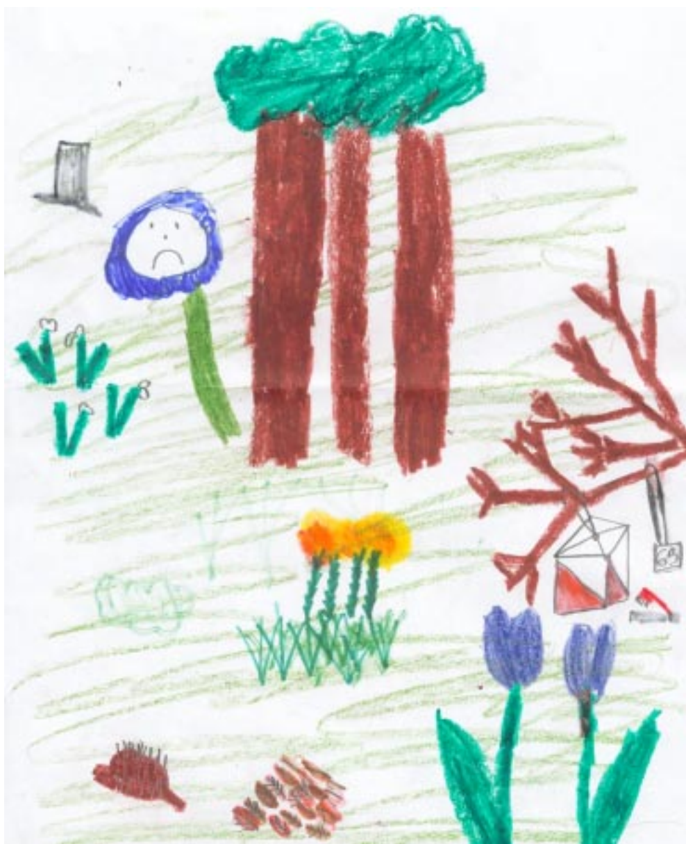
Teckning: Johanna Thunman